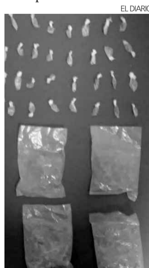
Droga asegurada por las autoridades.