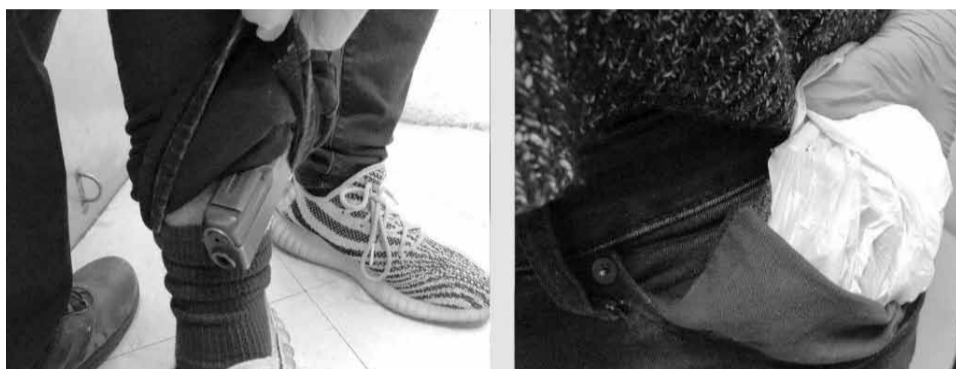
Oculto entre sus ropas, el sujeto llevaba armas de fuego y cartuchos útiles, sin especificar el tipo de calibre ni la cantidad de las municiones.

taminas y otros 2.2 (4.9) de cocaína, iban ocultos en el compartimento debajo del asiento de este vehículo de dos ruedas.