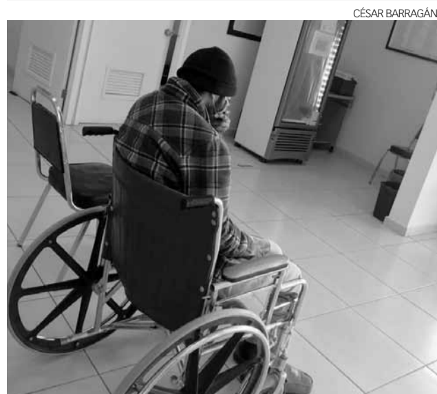
Elementos de Unavim, trasladan al estadounidense discapacitado a la "Casa de Sueños Nana".