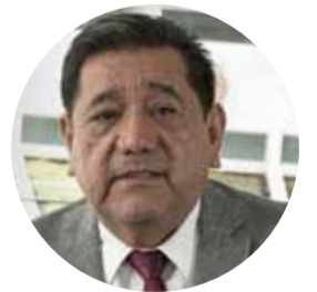
Félix Salgado Macedonio Ex candidato a la gubernatura de Guerrero por Morena

"A ellos se les olvidó que soy senador de la República con licencia, y me van oír mi pico en la tribuna, y ahora sí me los voy a chingar, me los voy a chingar y bonito, ahí nos vamos a ver las cara, el INE y el Trife (sic), yo ya les dije".