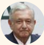
Andrés Manuel López Obrador.

El saldo fue de 18 votos a favor de iniciar las negociaciones con el Instituto Nacional de Suelo Sustentable (Insus), solo con un sufragio en contra de los regidores asistentes.