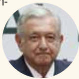
Andrés Manuel López Obrador.

Pero mejor aquí la dejamos, no sin antes recordarles que para cualquier invitación, columpio, preguntas, aclaraciones, sugerencias, dudas o ampliación de las mismas, pueden escribir a: lapirinola@eldiariodesonora.com.mx