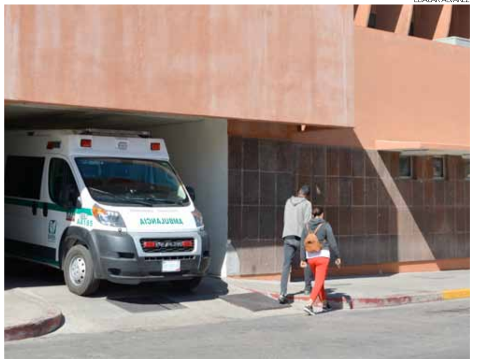
Una intoxicación por drogas derivó una persona muerta y seis más con graves complicaciones de salud en hechos ocurridos en el edificio 2 "B" del conjunto habitacional Canoas.

Los policías observaron a varias personas del sexo masculino inmóviles tendidas en el piso, por lo que solicitaron la presencia de la Cruz Roja cuyas ambulancias traslada-