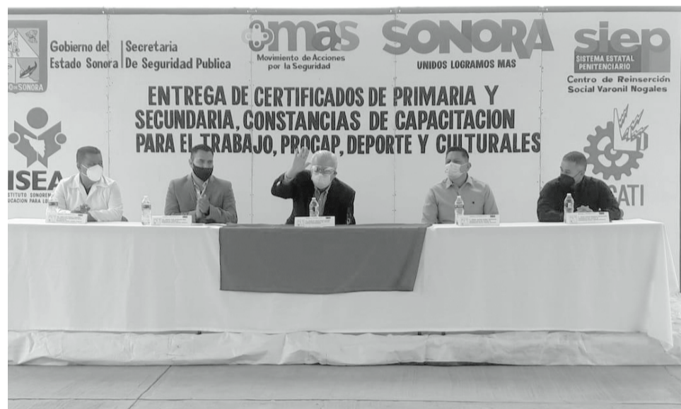
En el Cereso de Nogales se llevó a cabo la ceremonia de entrega de documentos oficiales de estudios de nivel primaria y secundaria, así como cursos de capacitación para el trabajo.

enciaria", así como constancias de participación en actividades deportivas y culturales.