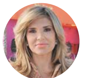
Claudia Pavlovich Arellano Gobernadora de Sonora

“...las personas que más lo necesitan cuentan con el respaldo del Gobierno del Estado, a través de proyectos productivos como “Pa’ Lante, familias solidarias”, que mejoran su calidad de vida, para enfrentar tiempos difíciles”.